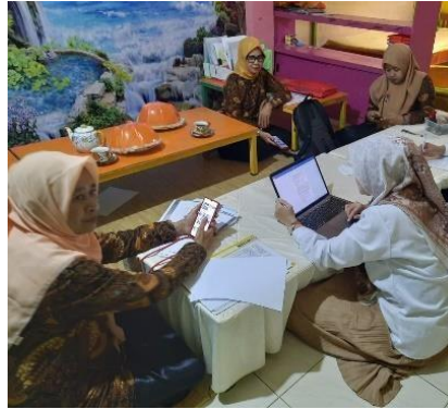
Gambar 1. Proses Analisis Situasi (Survey) permasalahan Mitra bersama pengurus gugus PAUD Kec. Tamalanrea

Penerbit: P3M Sekolah Tinggi Agama Islam Miftahul Huda Subang Jl. Raya Rancasari Dalam No.B33, Rancasari, Kec. Pamanukan, Kabupaten Subang, Jawa Barat 41254