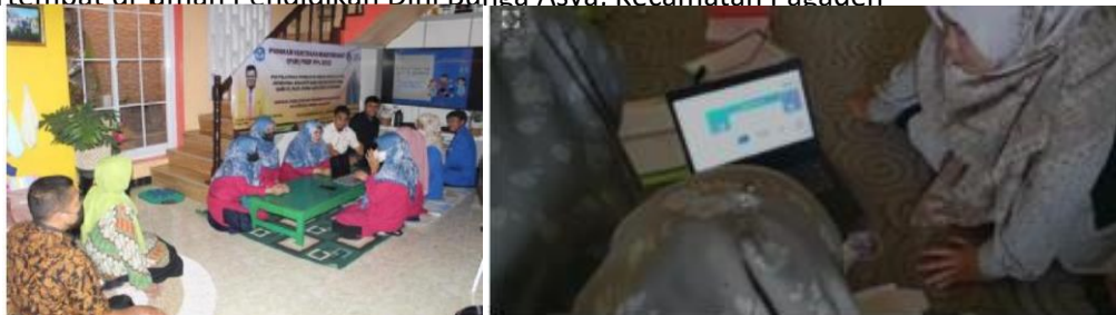
Gambar 2. Pelatihan hari pertama

bertempat di Taman Pendidikan Dini Bunga Asya, Kecamatan Pagaden