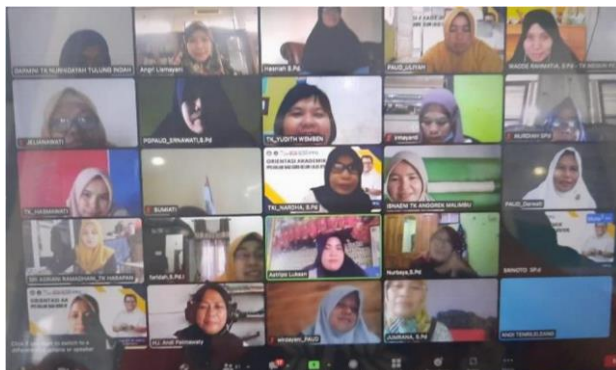
Gambar 3. Pelatihan hari Kedua

Kegiatan hari pertama diawali dengan pengenalan platform Canva kepada guru-guru PAUD Kecamatan Tamalanrea. Pengenalan canva meliputi memilih template, mengedit teks, dan menambahkan gambar atau elemen lainnya.